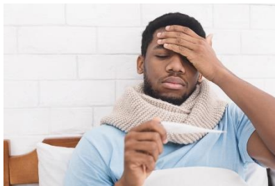
Fiebre de 100.4° o más